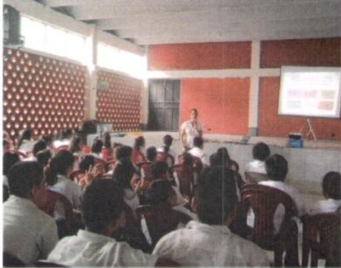
INEB Adscrito al Instituto Nacional de Perito En Mercadotecnia y Publicidad Escuintla, Escuintla