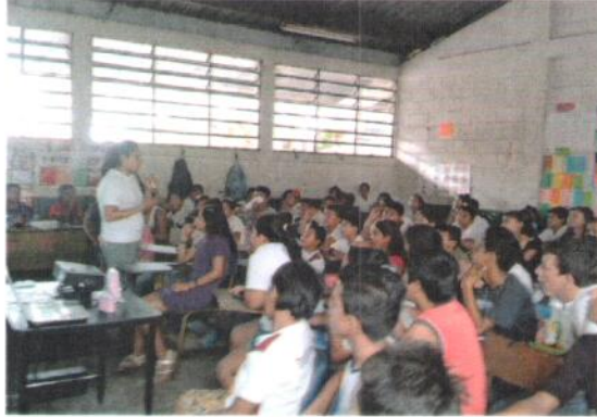
Escuela Oficial Rural Mixta, Salinas El Esfuerzo Primaria Jornada Matutina, Ubicada en San José, Escauintla Visitado el 23 de abril del 2015