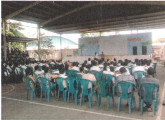
INEB Con Orientación Comercial Adscrito a Escuela Nacional de Ciencias Comerciales, jornada Matutina Escuintla, Tiquisate visitado el 21 de abril del 2015